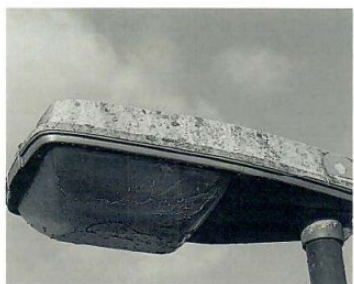
Armatyr i dag