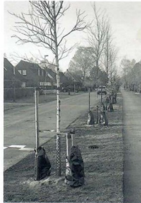
Båtsmansvägen i morgon?

Kommunen är en frikostig trädplanterare, men har av någon anledning totalt negligerat Skanörsgården