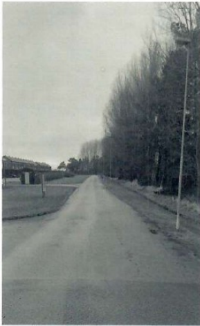
Båtsmansvägen i dag.

Miljön vid Båtsmansvägens är beskriven i punkterna 1-4 i skrivelsen och har här kompletterats med en del bilder: