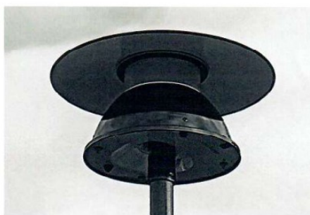
Armatyr i morgon?

Skanörsgården är det enda bostadsområde på hela näset som har kvar den gamla belysningsarmaturen! I övriga områden har man bytt ut till moderna armaturer av olika typer.